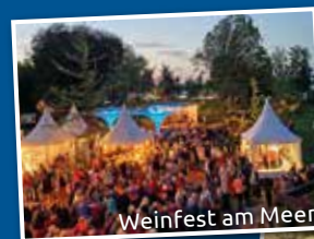
Weinfest am Meer