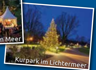
Kurpark im Lichtermeer